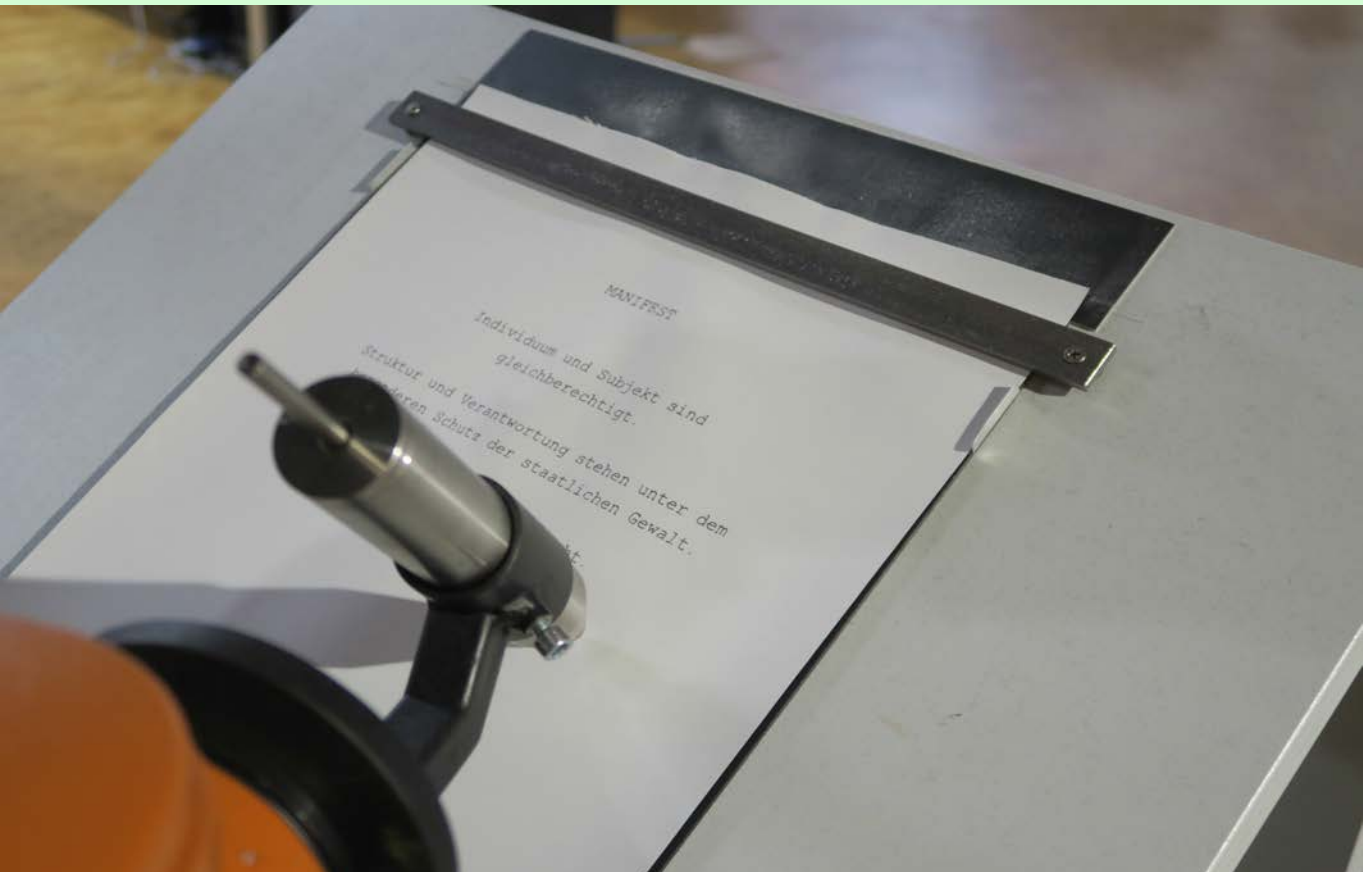
robotlab, manifest , 2008/2017, Industrieroboter, Schreibpult, Computer, Software, Papier, Stift, in der Ausstellung OPEN CODES. LEBEN IN DIGITALEN WELTEN am ZKM | Karlsruhe